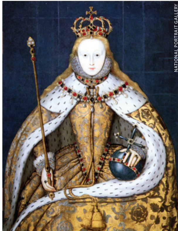
NATIONAL PORTRAIT GALLERY

Baina teoria horrek ez du inolako oinarririk. Batetik, inork gutxik espero zuen Elisabet erregina izatea. Ustezko heriotza